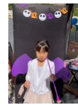
衣装してきた子ども達。思い思いの衣装でポーズ！

秋の収穫をお祝いし、先祖の霊をお迎えするとともに悪霊を追い払うお祭り。古代ケルト人が行っていたお祭りに由来しているようです。