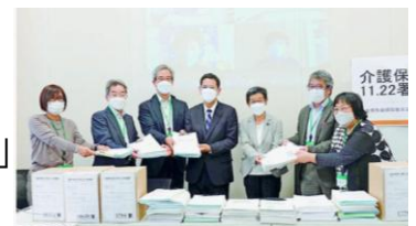
皆さんから集めた署名は11/22国会に届けました。

また中央社協はこの改悪を阻止しようと利用者や従事者の現場からの「私のひとこと」を介護保険部会に届ける運動を提起し、地域福祉社会ああすも利用者からの声を集め国会に届けることに協力しました。