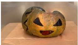
ああすの裏庭でできたカボチャ

秋の収穫をお祝いし、先祖の霊をお迎えするとともに悪霊を追い払うお祭り。古代ケルト人が行っていたお祭りに由来しているようです。