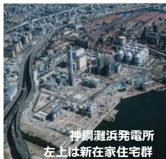
神鋼灘浜発電所 左上は新在家居宅群