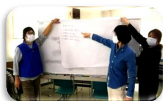
話し合ったことを発表