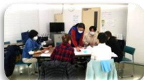
グループで困ったことを出し合い・・・